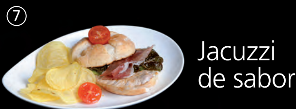
Jacuzzi de sabor