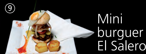
Mini burger El Salero