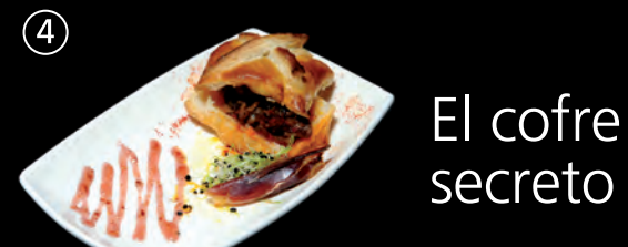
El cofre secreto