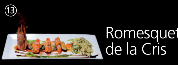
Romesquet de la Cris