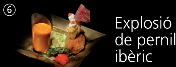
Explosió de pernil ibèric