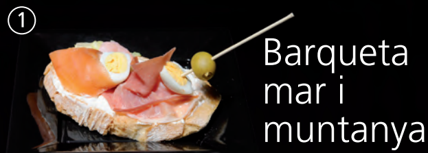
Barqueta mar i muntanya