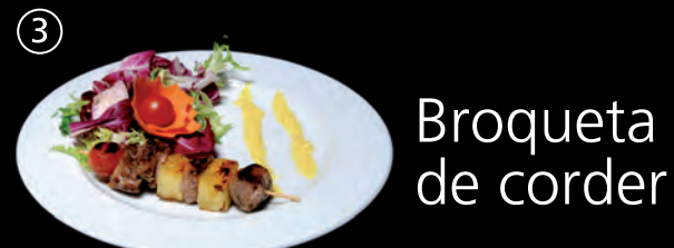
Broqueta de corder